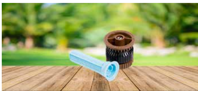
BOQUILLA RAIN BIRD SERIE HE-VAN