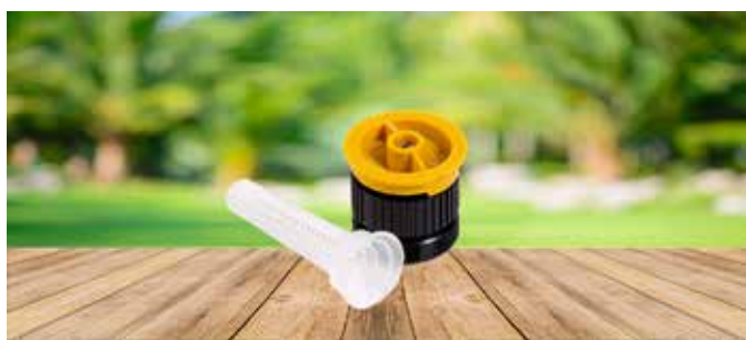
BOQUILLA RAIN BIRD SERIE R-VAN