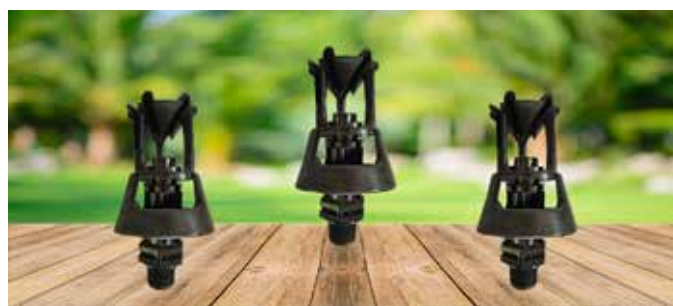
ASPERSOR TIPO XCEL-WOBLER