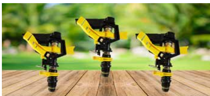
ASPERSOR DE IMPACTO AJUSTABLE DE 1/2"