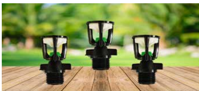
ASPERSOR TIPO MINI WOBLER