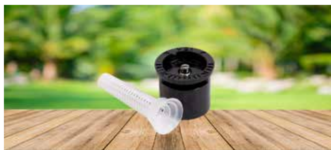
BOQUILLA RAIN BIRD SERIE MPR