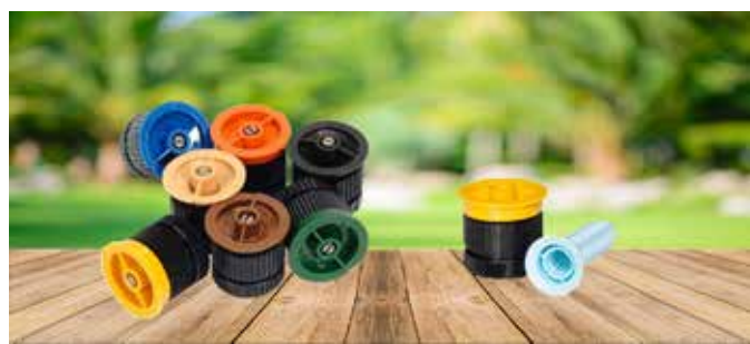
BOQUILLA RAIN BIRD SERIE VAN